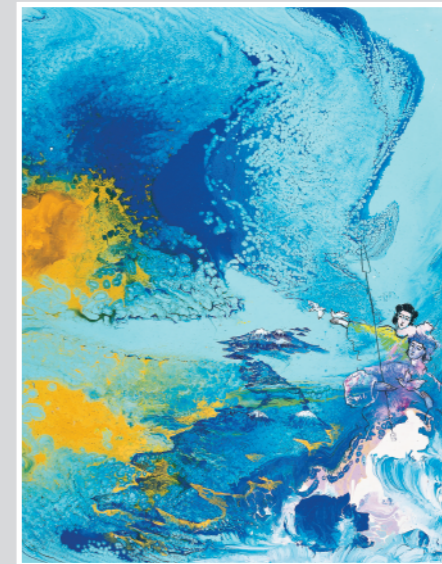
大八島の誕生 手彩入ジクレー版画 50.0×38.0