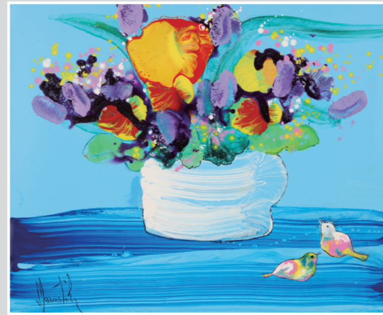
楽園の鳥たち 油彩 15F