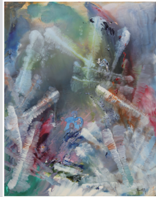
高天原の音楽会 油彩 30F