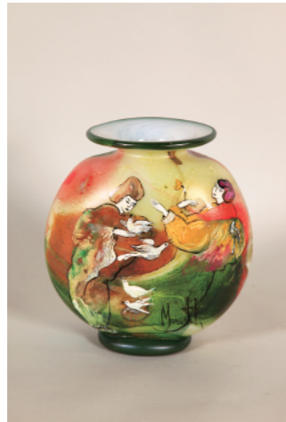
週遊芸命と木花之佐久夜昆売の初愛を祝福する鳥たち 22×14.5×24.8