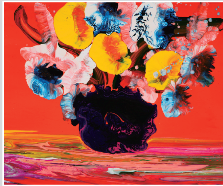
陽気な音楽 油彩 8F