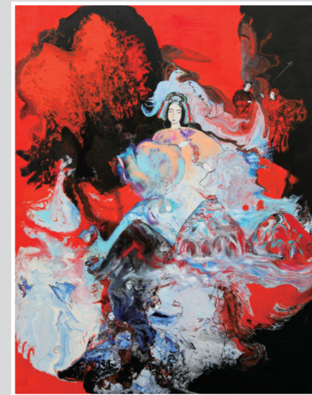
白山比咩神社奉納作品 菊理媛命の寛大な愛 手彩入ジクレー版画 48.6×38.0