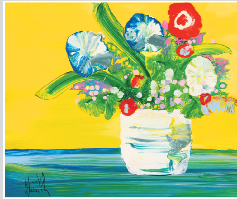
私たちの心を照らす太陽 油彩 10F