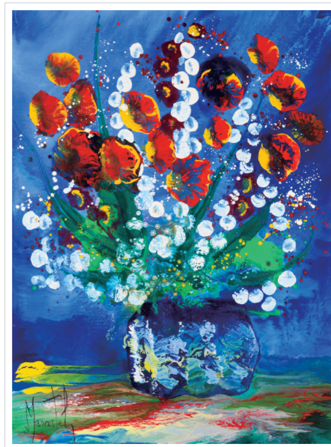
豊玉昆売の愛のブーケ 油彩 60F

2016 6/7 (火) - 12 (日) 11:00 ~ 18:30 最終日は16:00まで