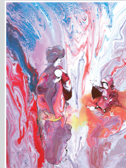
鏡神社奉納作品 神功皇后と応神天皇の愛 手彩入ジクレー版画 53.1×38.0