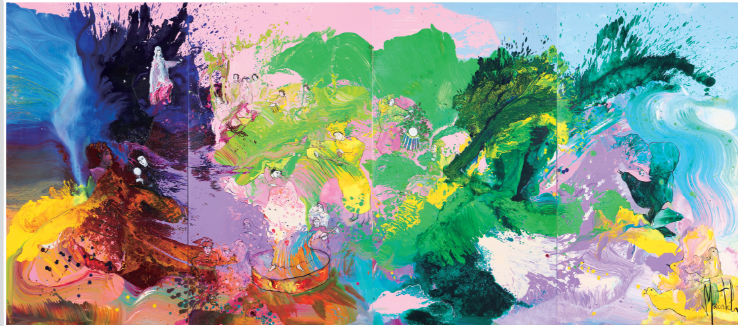
伊勢神宮奉納作品 神々の神聖な祭りによる天照大御神の復活、そして世界は甦った 4曲屏風 手彩入ジクレー版画 140×320