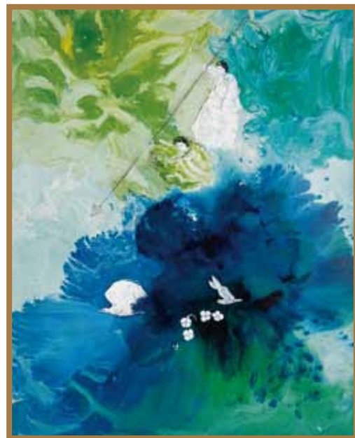
伊邪那岐命、伊邪那美命の国造り 油彩 40F

この度、由緒ある椿大神社への作品奉納の機会を与えられましたことは、誠に有難く光栄の至りと心より感謝いたしております。今日まで作品奉納を続けることができましたのも、ご支援いただいた皆さまのお蔭と厚く御礼申し上げます。名古屋の皆さまにはたいへんお世話になっており、慕わしい地で本年も作品を発表できますことを嬉しく思います。