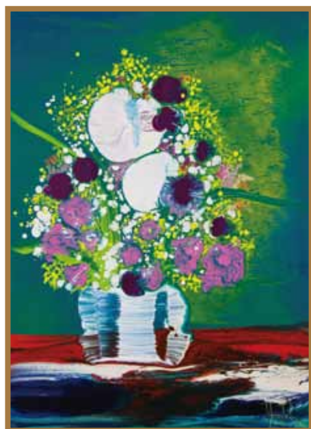
愛を込めた花束 油彩 25P