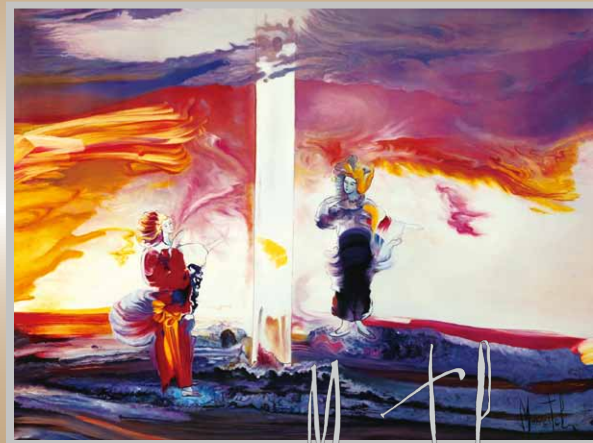
八尋殿の周りで輪舞 漆 80F