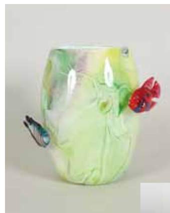
浅瀬のメロディ ガラス作品 φ22×25