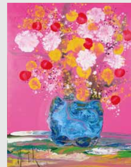
モーツァルトの愛のメロディ 手彩入ジクレー版画 20F

東京会場 / ギャラリー マークエステル 東京都千代田区内幸町1丁目1-1 帝国ホテルプラザ3F TEL. 03-6811-2335 https://h-a-t.jp