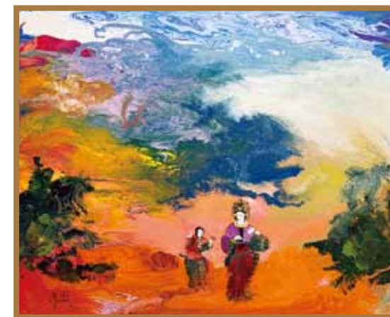
天照大御神の愛の庭 油彩 20F