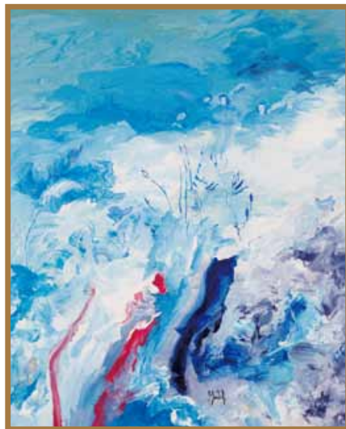
別天神（五神）と世界の始まり 油彩 40F