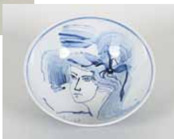
天照大御神の寛大な愛 京焼 φ29×10.2