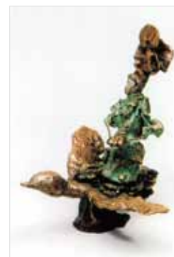
第1回 伊勢神宮奉納作品 天照大御神 ブロンズ 30×30×50

椿大神社(三重県)の奉納報告祭(5月24日[火] 11時~)に御参加ご希望の方は、下記までご連絡ください。 連絡先: 080-1090-2660 / H&T 濱崎佐知子