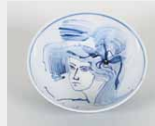
天照大御神の寛大な愛 φ29.0×10.2