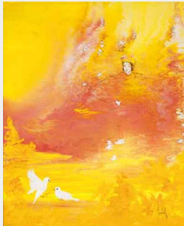
天照大御神の祝福を運ぶ小鳥たち 油彩 40F

この度、浜松と福岡で作品発表の機会を頂きましたことをたいへん嬉しく思っております。初来日以来、約半世紀にわたり創作活動を続けることができましたのもご支援してくださる方々のお蔭と心より感謝しています。作品には作者の心がそのまま現れます。そのためいつも襟を正される思いです。マークエステル 愛と心は人生の作品です。