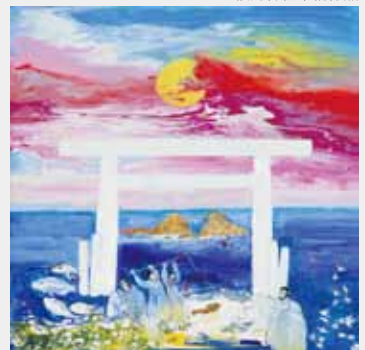
伊邪那岐命の愛の視から誕生した神直日神、大直日神、八十柱津日神 40.0×40.0