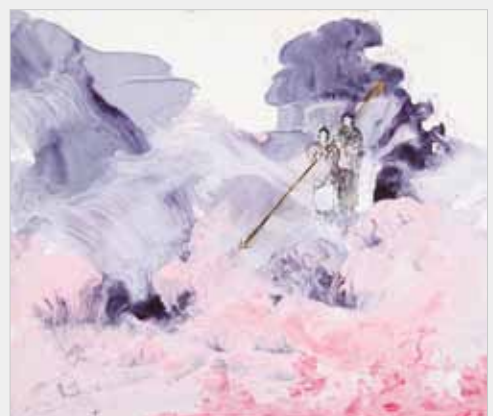
伊邪那岐命、伊邪那美命 - 愛の運命 油彩 10F