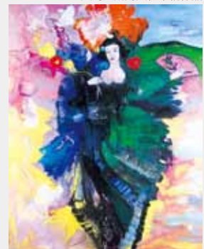
天宇受売命の平和の愛の踊り 44.8×38.0