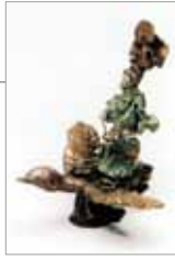
伊勢神宮奉納作品