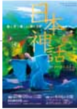
公演パンフレット

浜松会場 / クリエイト浜松 3F ギャラリー 35 静岡県浜松市中区早馬町 2-1 http://www.hcf.or.jp/facilities/create/