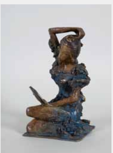
身縋いをする天宇受売命 ブロンズ 11.5×11.5×21