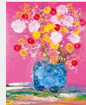
モーツァルトの愛のメロディ 20F