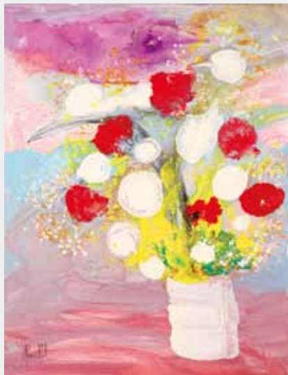
春の優しさ 油彩 50F