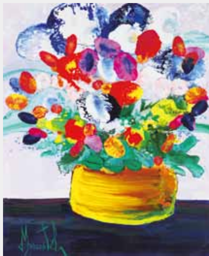
天国のブーケ 油彩 40F