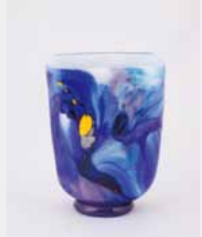
海に差し込む太陽の光 ガラス工芸品 21×14×28