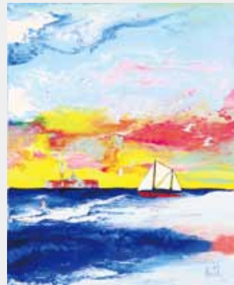
光輝くベニス 油彩 20F