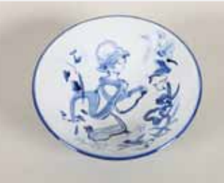
愛の庭の天照大御神 φ25.5×8.3