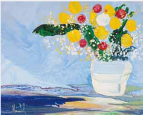
カップエステルのロマンス 油彩 30F