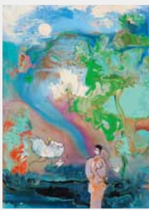
森の中の夢 油彩 4F