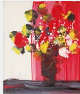
赤いカーテンとブーケ 油彩 8F