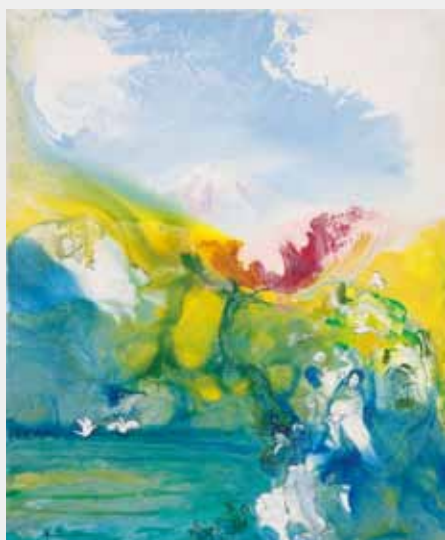
幸せの富士 油彩 20F