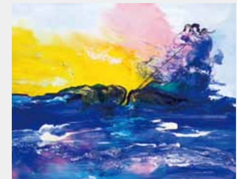
浜能碁呂島に注がれた愛の光 40.0×50.2