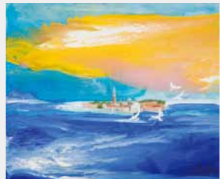
清々しいベニスの光 38.0×46.4