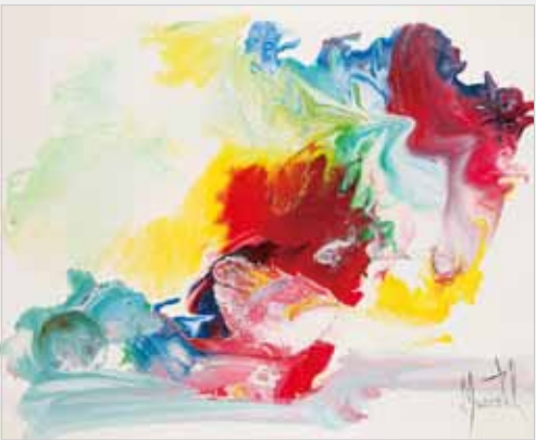
愛の流れ 油彩 50F