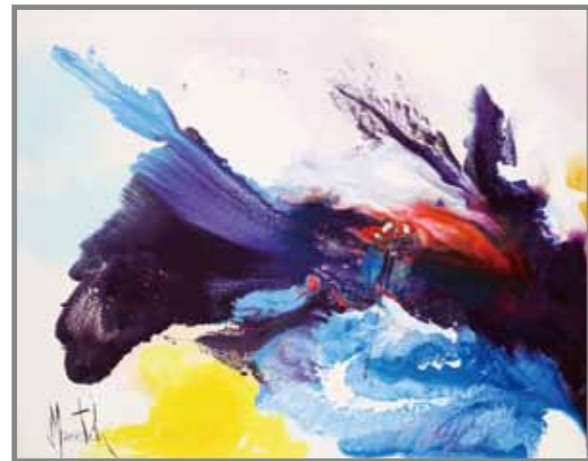
伊邪那岐命と伊邪那美命の淤能碁呂島での第一歩 油彩 80F

画集「日本神話 by MARCESTEL」 世界7か国語版で古事記の作品 200点掲載