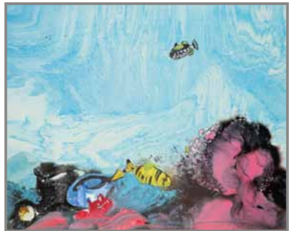
深海のメロディ 油彩 40F