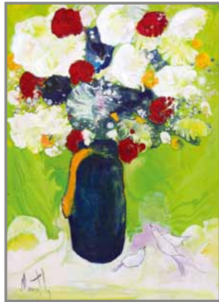
見事なブーケ 油彩 40P