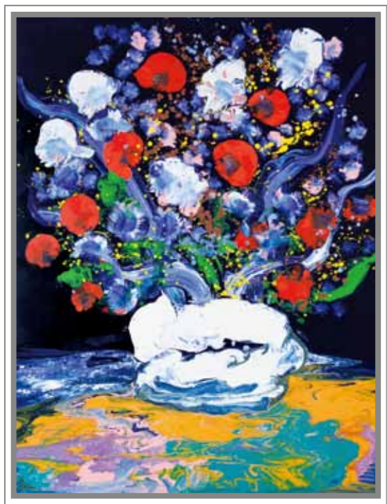
私たちに溢れる愛と希望 油彩 80F

日本は、たいへん魅力溢れる国です。私は若かりし日、この国にひと目惚れし画家になることを決意しました。繊細な思いやりの心を持つ母のような国、日本。この国の素晴らしさに世界の人々が気づき始めた今、憧憬の国として更に輝き、世界を導いてくれることを願ってやみません。この度、会場をご提供くださった坪井様には心より感謝いたしております。