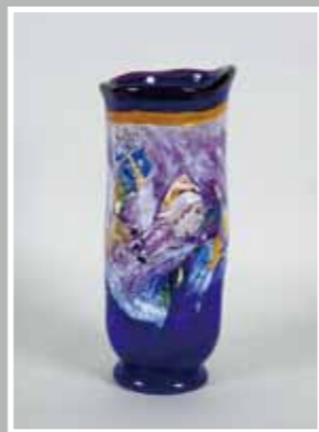
愛と安らぎ ガラス作品 15x15x50