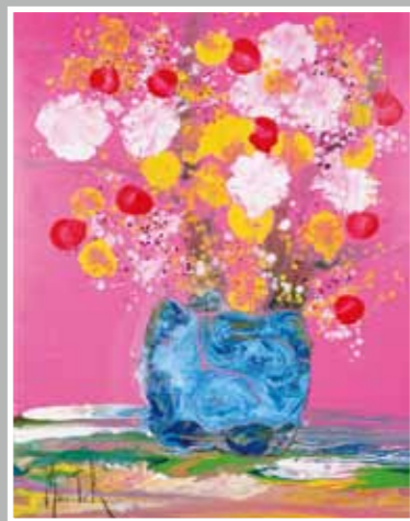
モーツァルトの愛のメロディ 49x38 手彩入ジクレー版画