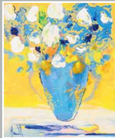
光溢れるブーケ 45.8x38 手彩入ジクレー版画