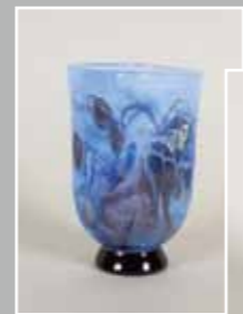
左：空の愛のメッセージ ガラス作品 13x6.5x18