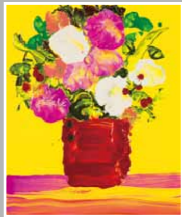
眩い光に包まれたブーケ 油彩 8F

マークエステルが50年過ごしたホテル「カップエステル」は、格別美しく世界の要人達を魅了した。「カップエステル」は、彼の感性を育て芸術家になる導きとなった。