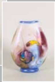
右：海の散歩道 ガラス作品 20x10x26