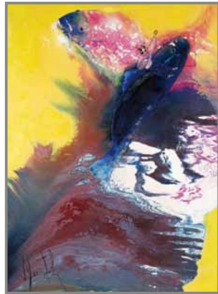
山佐知毘古は地に戻る 油彩 60F