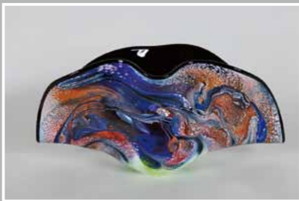
愛の光 ガラス作品 20x65x30