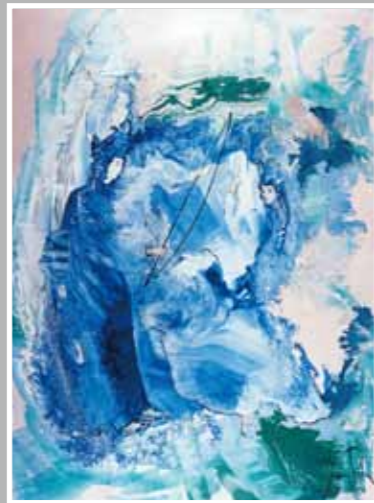
下照り売の美しさに驚く天若日子 51.3x38 手彩入ジクレー版画