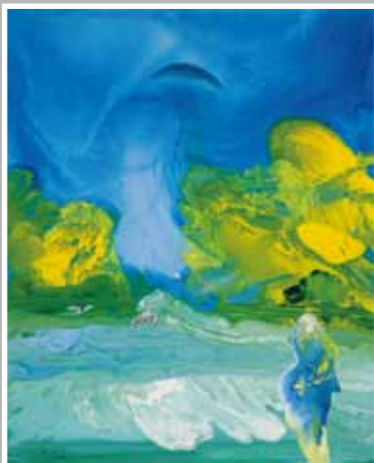
天照大神の寛大な愛 46.3x38 手彩入ジクレー版画