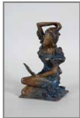
身繕いをする天宇受売命 ブロンズ 11.5x11.5x21