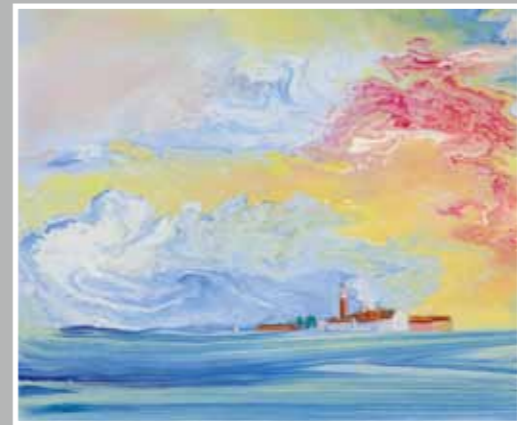
虹色に輝くペニス 油彩 8F