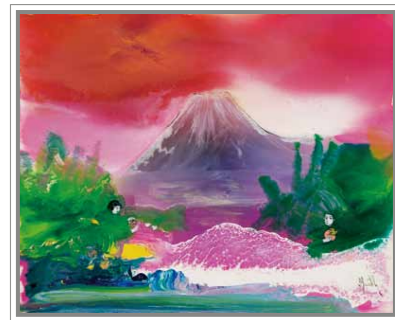
神秘的な富士山 油彩 25F

画業50周年記念 マークエステル展 10/19(月)▶25(日) 10:30~18:00 作家来場